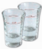
TABLE Z 1032185000 Stamper „Dublino“ 2 cl mit Rotring 6 Stück Stück = -.992 Karton brutto 7.08